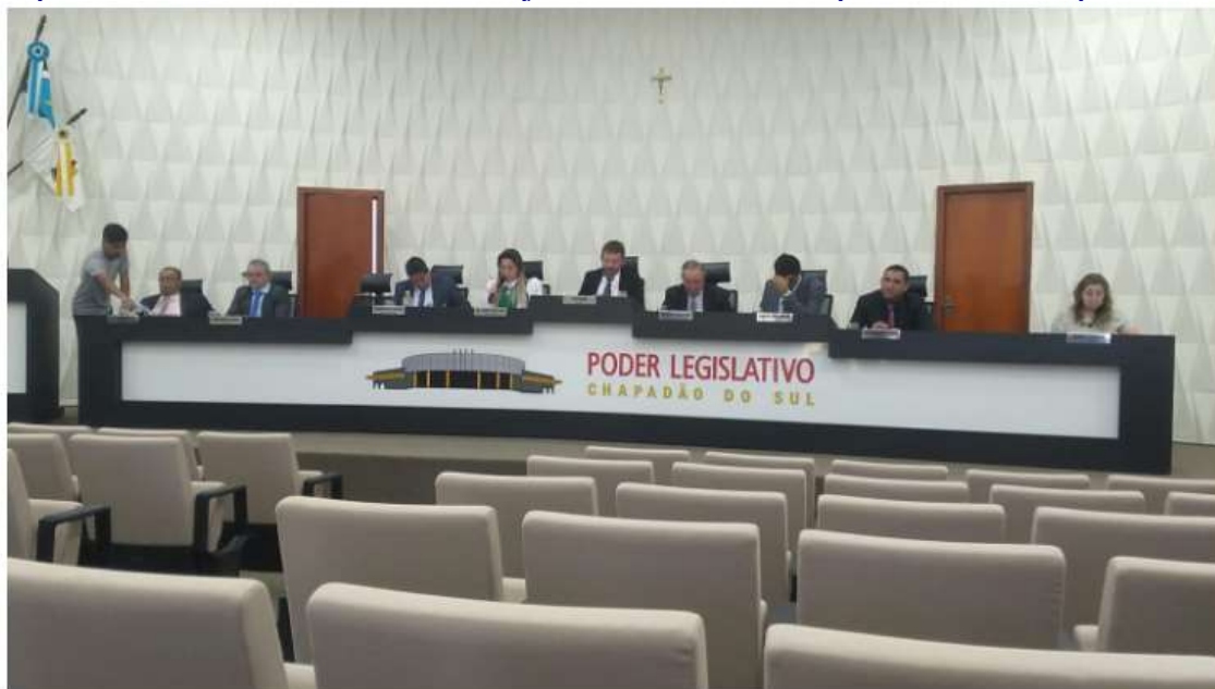
Sessão na Câmara Municipal de Chapadão do Sul na manhã desta terça-feira (02)

https://www.occureionews.com.br/dr-joao-buzoli-assume-a-prefeitura-de-chapadao-do-sul/