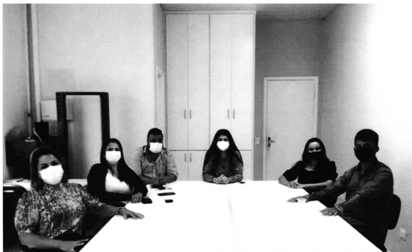
Visita à Dep. Federal Rose Modesto 19 de Janeiro