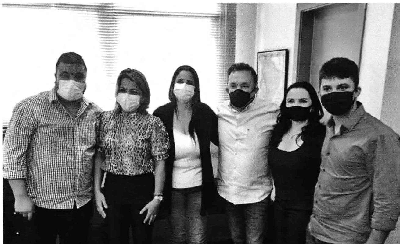
Visita ao Dep. Federal Vander Loubet 19 de Janeiro