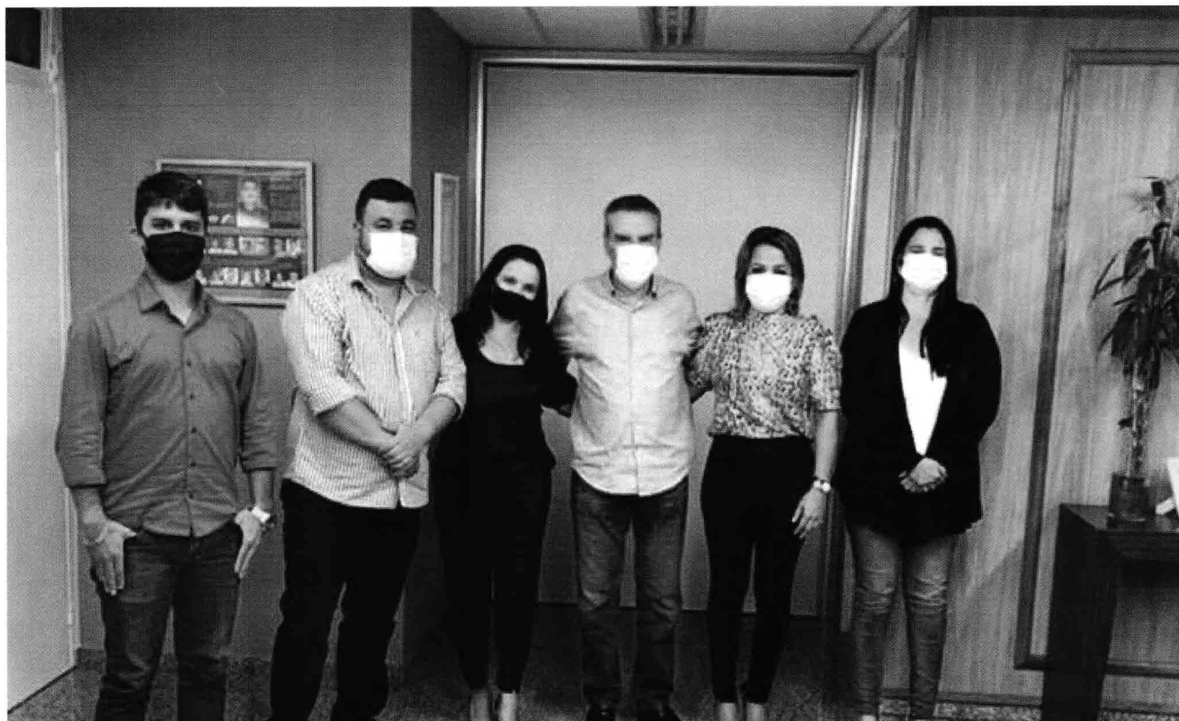
Visita ao Dep. Estadual e Presidente da Assembléia Paulo Correa 19 de Janeiro