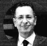
PAULO CEZAR (PROCURADOR DE JUSTIÇA)