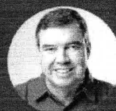
EDUARDO RIEDEL (GOVERNADOR)