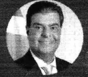
NELSINHO TRAD (SENADOR)